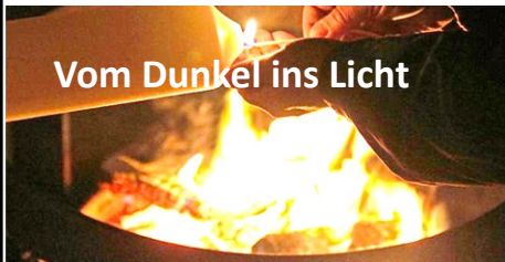
Vom Dunkel ins Licht

Die Osternachtliturgie ist die gefüllteste aller Gottesdienstformen der katholischen Kirche. Einen wesentli-