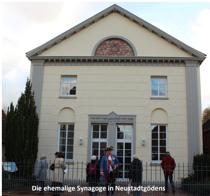
Die ehemalige Synagoge in Neustadtgödens

Unsere Pfarrgemeinden leben von dem Engagement und dem Einsatz vieler ehrenamtlicher Mitarbeiter. Um diese Arbeit zu würdigen, waren