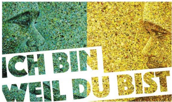
MISEREOR HUNGERTUCH 2017|2018

Spenden sammeln für eine bessere Welt am MISEREOR-Sonntag (zwei Wochen vor Ostern), diese Fastenaktion ist Jahr für Jahr eine großartige Bewegung der Hilfe. Viele Hundert Initiativen, Ideen, Veranstaltungen werden auf die Beine gestellt. Viele Tausend Kinder, Jugendliche, Frauen und Männer bitten um Spenden für Hilfe in Afrika, Asien und Lateinamerika. Die Kollekte am 5. Fastensonntag und die Spenden, die durch Solidaritätsaktionen gesammelt werden, sind das Fundament der erfolgreichen MISEREOR-Arbeit .